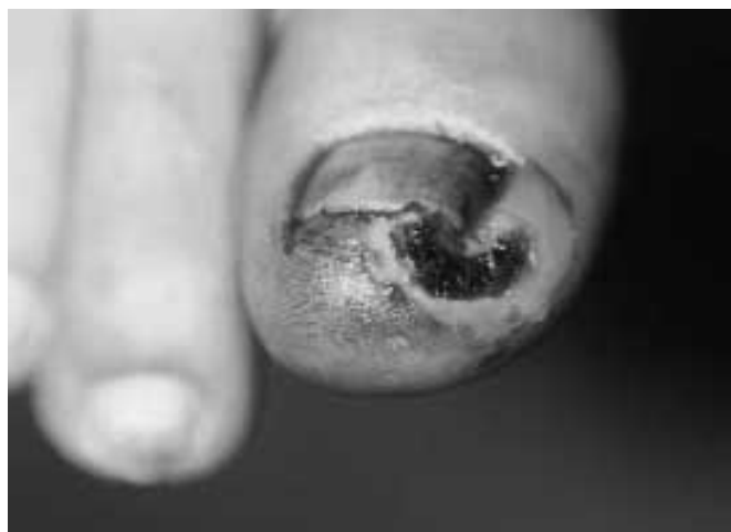
Fig. 4. Necroza halucelui drept / Right hallux necrosis