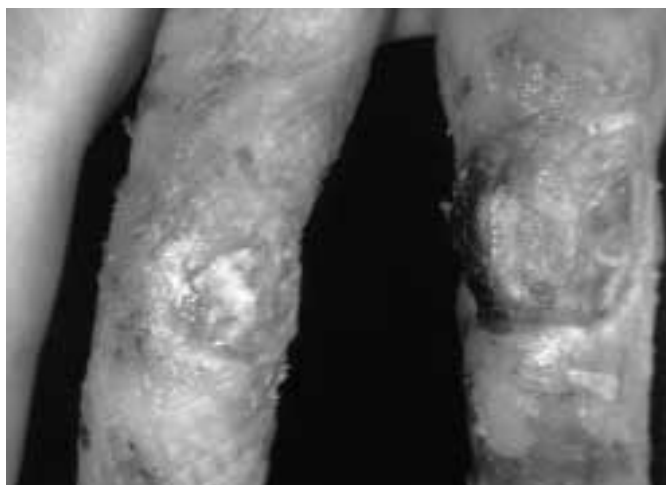
Fig. 1. Defectele digitale dorsale după eșuarea lamboului digital încrucișat / Digital dorsal defects after the failed cross finger flap