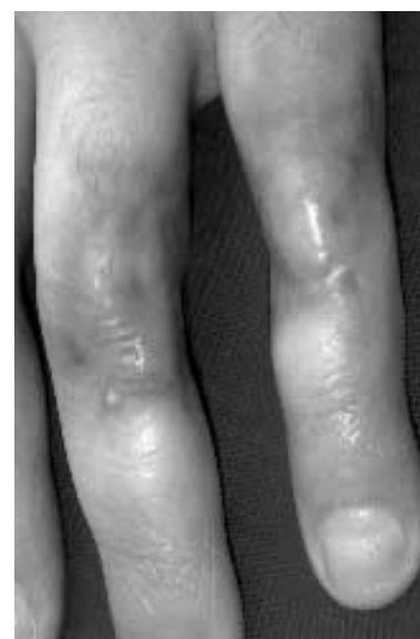
Fig. 7. Defectele digitale vindecate (după tratamentul cu ilomedin) / Digital defects healed (after treatment with ilomedin)