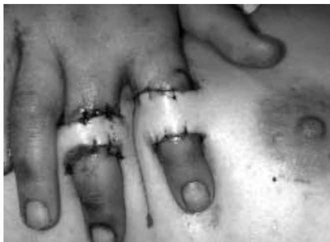
Fig. 2. Lambourile submamare pentru acoperirea defectului digital / Submammary flaps for digital defect coverage