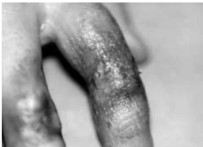
Fig. 3. Necroza parțială a lambourilor (30%) după expunerea la frig / Partial flaps necrosis (30%) after cold exposure