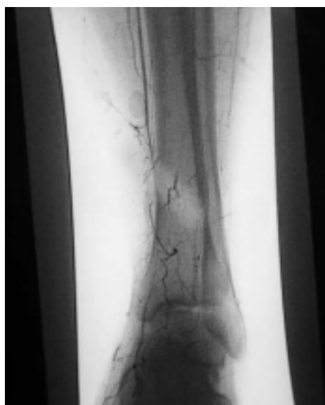
Fig. 6. Angiografia membrului inferior drept (obstrucție vasculară) / Right lower limb angiography (vascular obstruction)